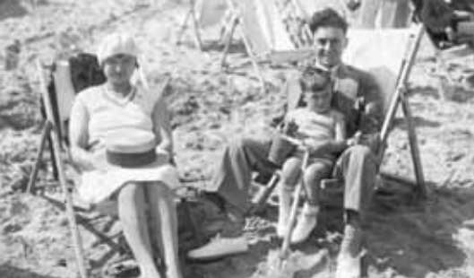
Familieportret op het strand van Blankenberge tijdens een zomerse dag (1963), Collectie Stadsarchief Sint-Niklaas