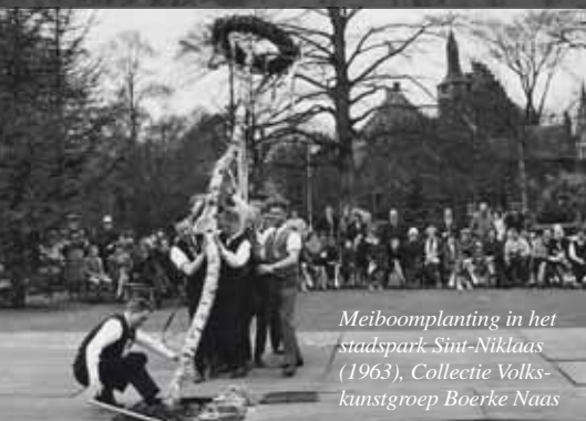
Meiboomplanting in het stadspark Sint-Niklaas (1963)