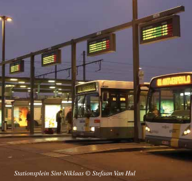
Stationsplein Sint-Niklaas