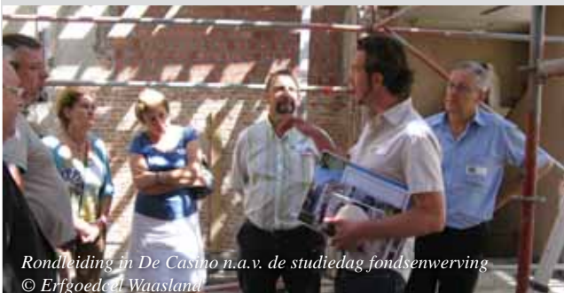
Rondleiding in De Casino n.a.v. de studiedag fondsenwerving

Op 5 en 19 juni vonden twee studiedagen over succesvolle fondsenwerving plaats i.s.m. vzw De Spiegel uit Sint-Niklaas en Tolerant vzw uit Kruikebeke. Daarnaast werkt de Erfgoedcel Waasland i.s.m. FARO, steunpunt voor cultureel erfgoed en HET FORUM een publicatie uit met een volledig geactualiseerd en uitgebreid overzicht van financiële mogelijkheden voor erfgoedverenigingen.