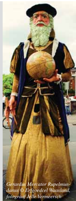
Gerardus Mercator Rupelmondanus