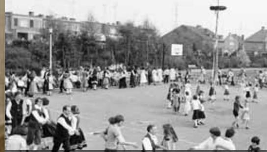
Kringdansen op het Baenslandplein te Sint-Niklaas (1973), Collectie Volkskunstgroep Boerke Naas