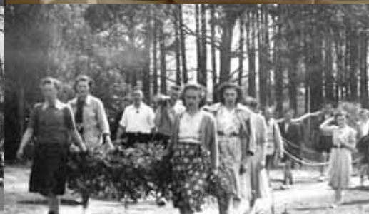
De Meiboom wordt stoetsgewijs naar 't meiveld in Waasmunster gedragen (1951)