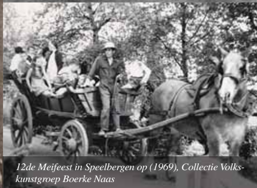
12de Meifeest in Speelbergen op (1969), Collectie Volkskunstgroep Boerke Naas

De afgelopen weken verschenen heel wat extra foto's op www.beeldbankwaasland.be : beelden op de grens tussen echt en namaak naar aanleiding van de Erfgoeddag, foto's die de volksgebruiken in het teken van de lente en de vruchtbaarheid naar aanleiding van de Meifeesten illustreren, e-cards voor Moeder- en Vaderdag en natuur en cultuur in het 'Soete Land van Waas'.