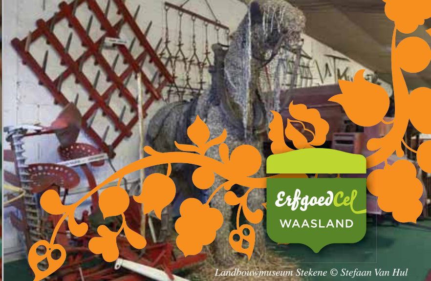
Landbouwmuseum Stekene