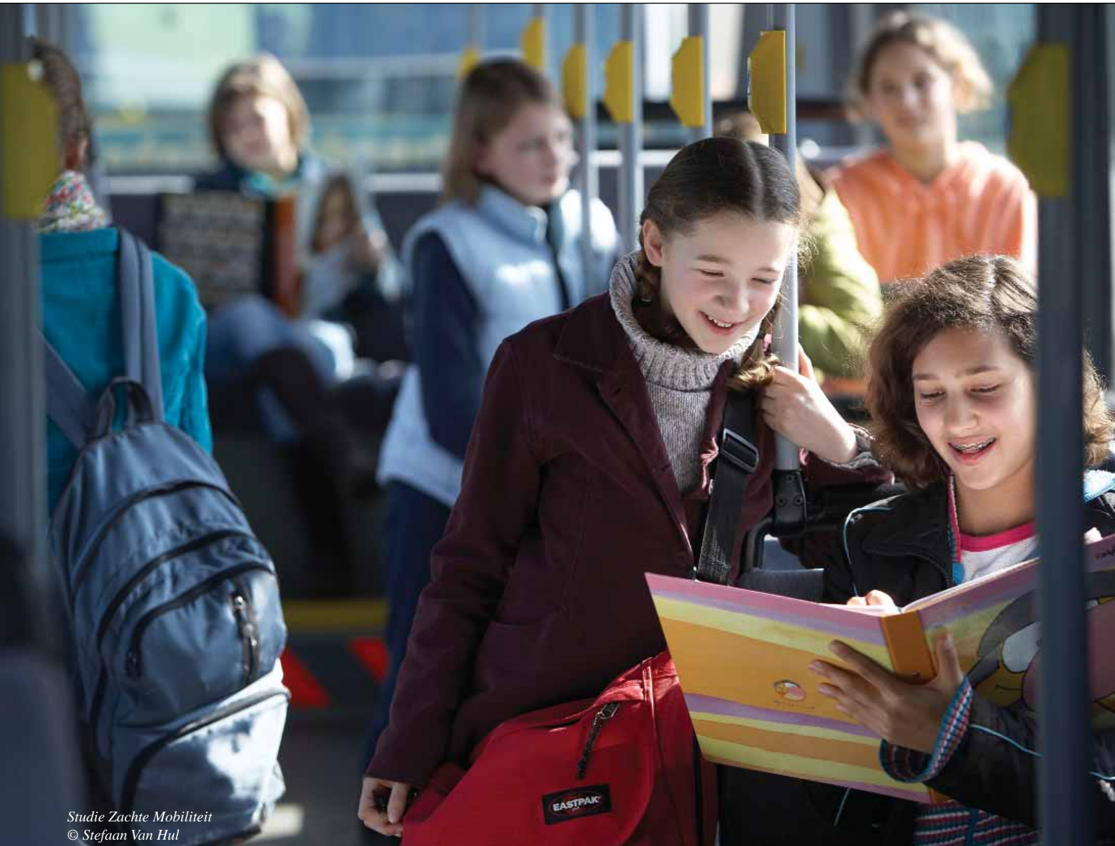
Studie Zachte Mobiliteit

Jaargang 20 • nr.2 • april - mei - juni 2010