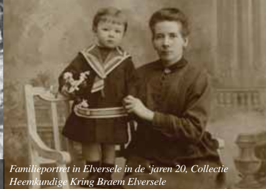
Familieportret in Elversele in de jaren 20