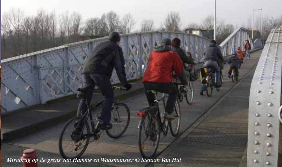
Mirabrug op de grens van Hamme en Waasmunster