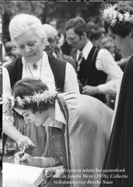
De Meigravin tekent het gastenboek van de familie Weyn (1978)