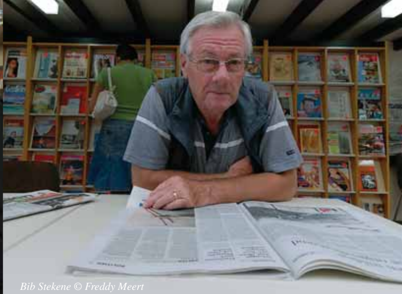
Bib Stekene © Freddy Meert