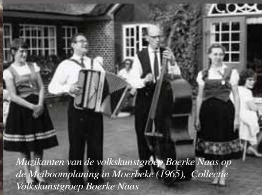
Muzikanten van de volkskunstgroep Boerke Naas op de Meiboomplanting in Moerbeke (1965)