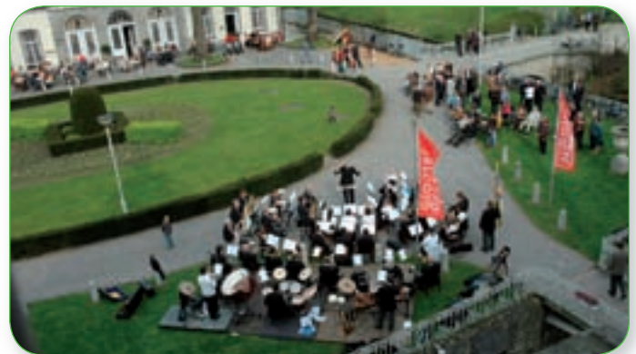
Erfgoeddag 2006 Beveren