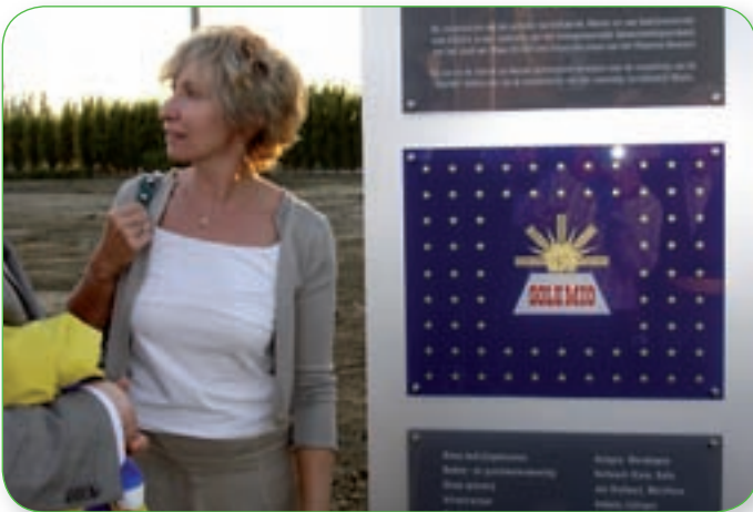
Vlaams Minister Fientje Moerman bij de opening van het bedrijventerrein Manta

Het Waasland beschikt over een oppervlakte van ruim 1.700 ha aan bedrijventerreinen. Het leeuwendeel van deze oppervlakte wordt bepaald door de terreinen van meer dan 5 ha groot, waarvan er in de regio een vijftigtal voorhanden zijn. Ongeveer 85% van de Wase bedrijventerreinen is te vinden in de vier stedelijke kernen: Beveren, Lokeren, Sint-Niklaas en Temse.